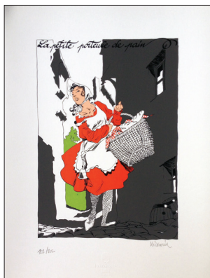
Séverin. 24x39 cm 5 passages couleurs