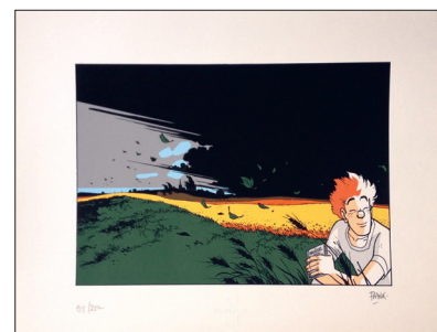
Frank. 24x39 cm. 6 passages couleurs