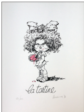
Hausman. 24x39 cm 2 passages couleurs