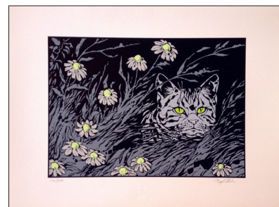
Comes. 24x39 cm. 5 passages couleurs

GRAINES pour favoriser la fertilité des ressources de chacun de SÉSAME pour que la société ouvre davantage ses portes à la personne handicapée